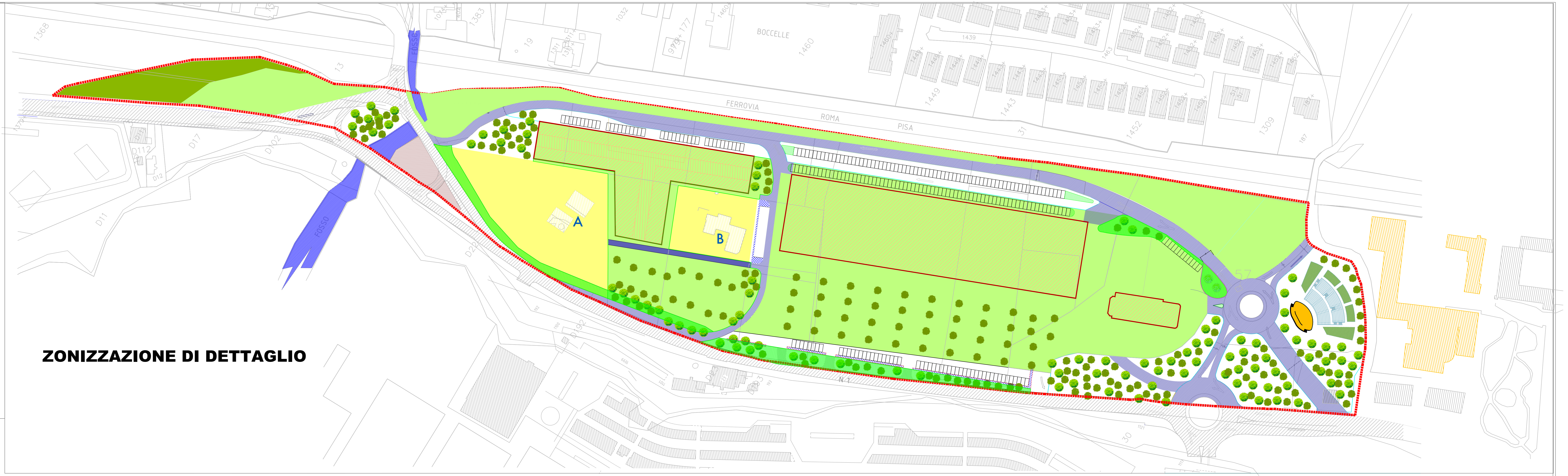
ZONIZZAZIONE DI DETTAGLIO