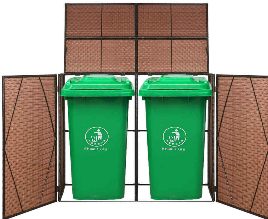
Illustrazione 5: modello5