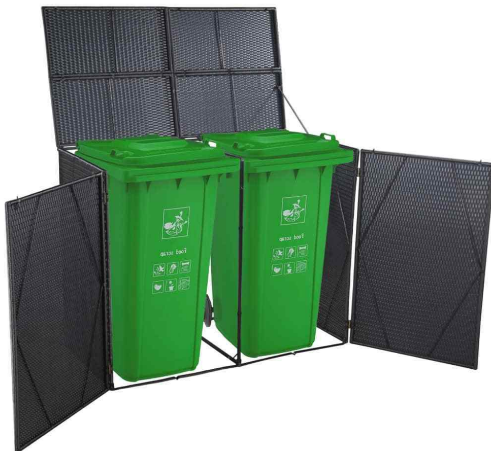
Illustrazione 4: modello4