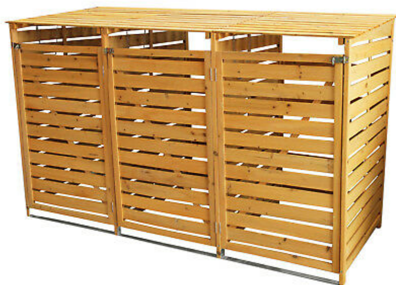
Illustrazione 2: Modello2