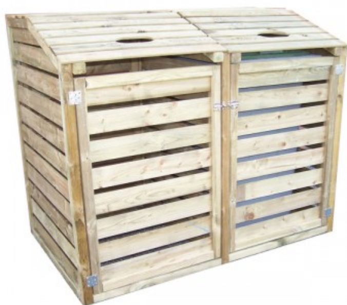
Illustrazione 3: modello3