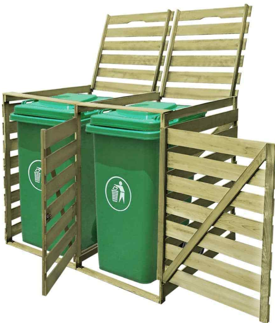
Illustrazione 1: modello1